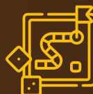
Risk Management Game-Based Simulation